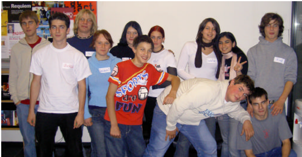
Jugendliche aus dem Netzwerk Vorarlberg (Bregenz, Dornbirn, Feldkirch, Hard)