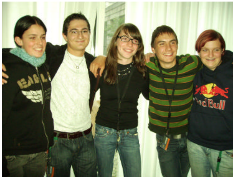
Geknüpfte Freundschaften am Ende der Untersuchungswoche