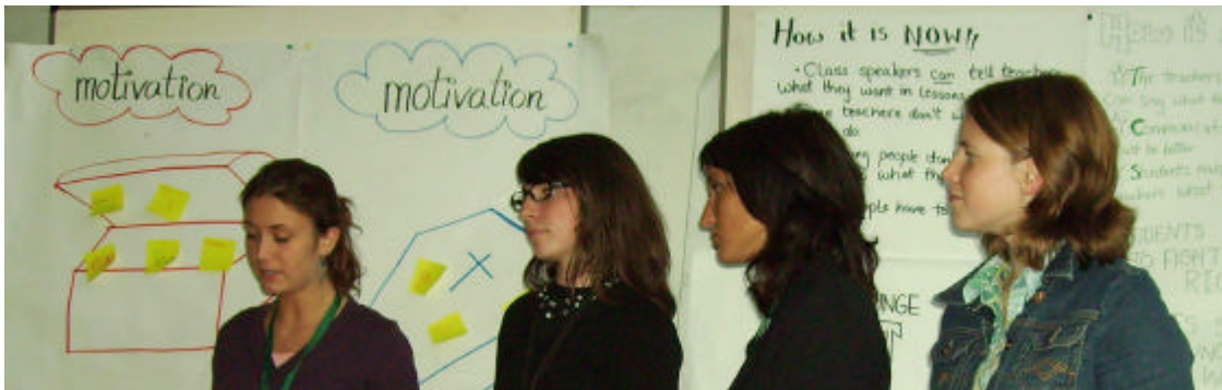
Präsentation im Landhaus Bregenz

Die Ergebnisse konnten dann am 28. September der Öffentlichkeit präsentiert werden. Selbstverständlich wurde die ganze Sache in englischer und deutscher Sprache von uns moderiert. Nach der eineinhalbstündigen Präsentation konnten wir dann unsere Arbeit abschließen um uns auf die Abschlussfeier vorzubereiten.